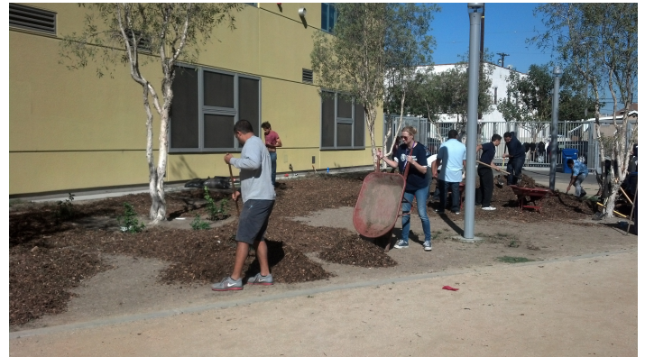
Top left: Pulling invasive species at Madrona Marsh; Top right: Packing food at the FoodBank; Middle left: Washing trains at Traveltown USA; Middle right: Planting the garden at MACHS; Bottom left: Cleaning Dockweiler Beach; Bottom right: Discussing budgets at Finance Park